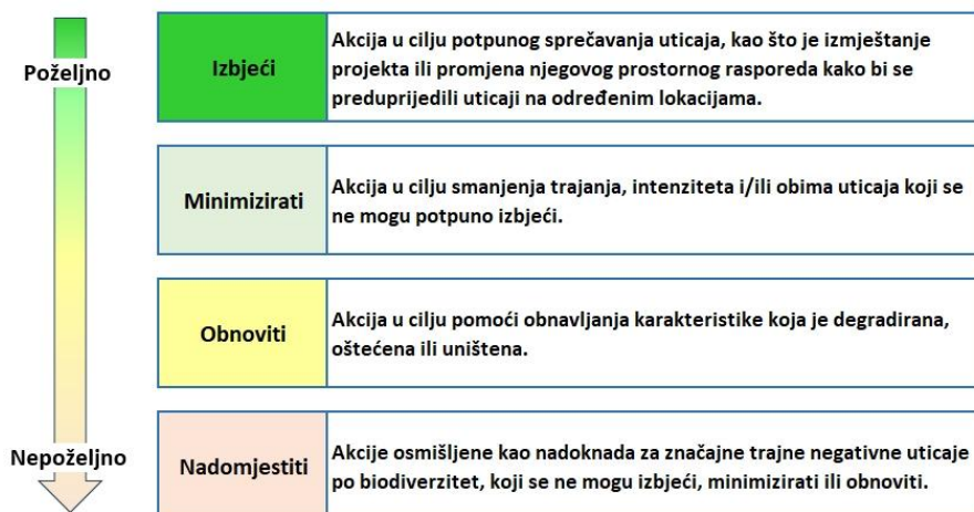
Slika 3: Hijerarhija ublažavanja

Jedan važan uticaj je trajni gubitak određenog broja staništa. Uticaj će se odnositi na cjelokupnu dužinu putne trase na kojoj se planira fizičko uklanjanje vegetacije, kao i oko vodotokova i za potrebe izgradnje mostova.