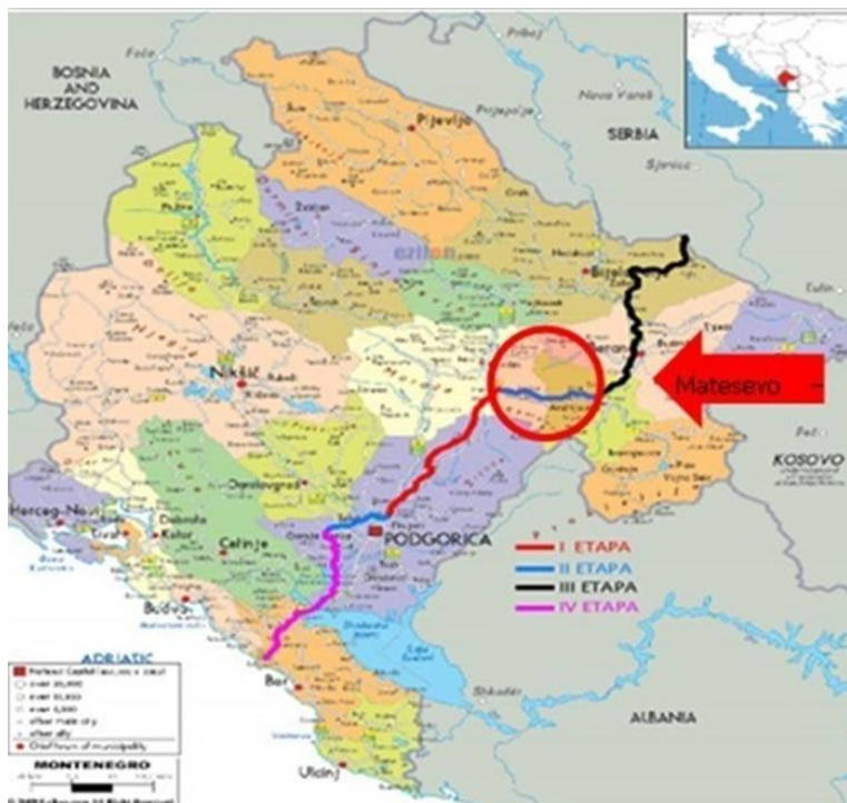
Slika 1: Autoput Bar-Boljare i dionica Mateševo-Andrijevića

Polazna tačka je poslije petlje Mateševo (dionica Smokovac – Mateševo). Završetak istražnog područja je područje rijeke Kraštica, pritoke Lima, kod Andrijevice. Dio dionice autoputa Mateševo-Andrijevića nalazi se u okviru opštine Kolašin, dok se ostatak nalazi u okviru opštine Andrijevića.