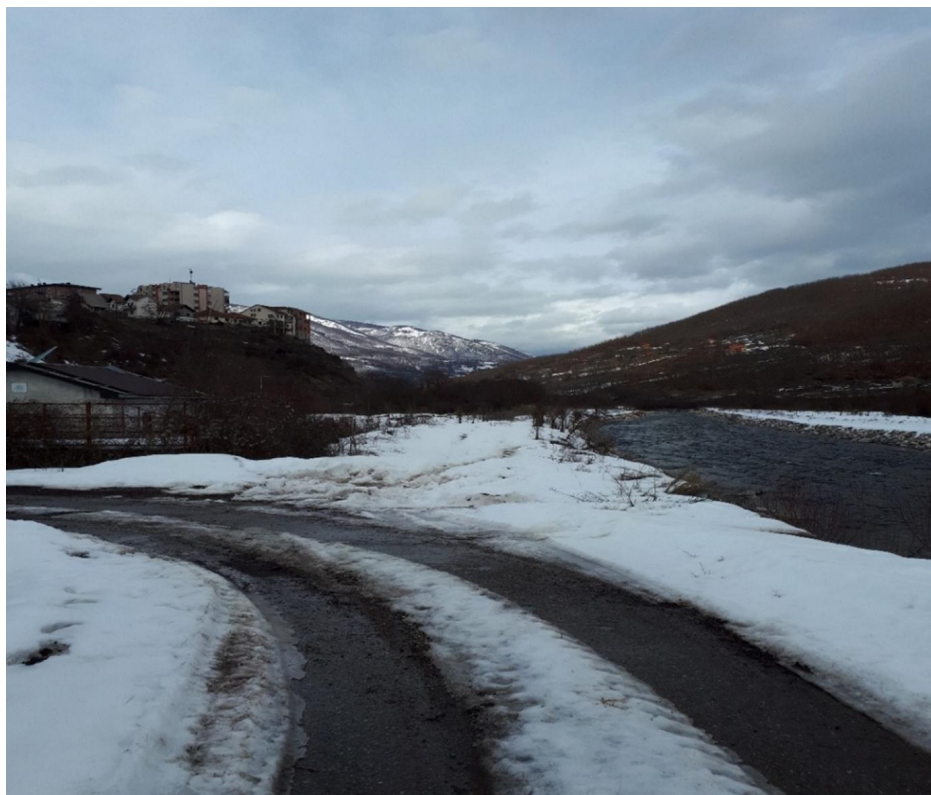
Slika 2. Pristupni put do lokacije projekta